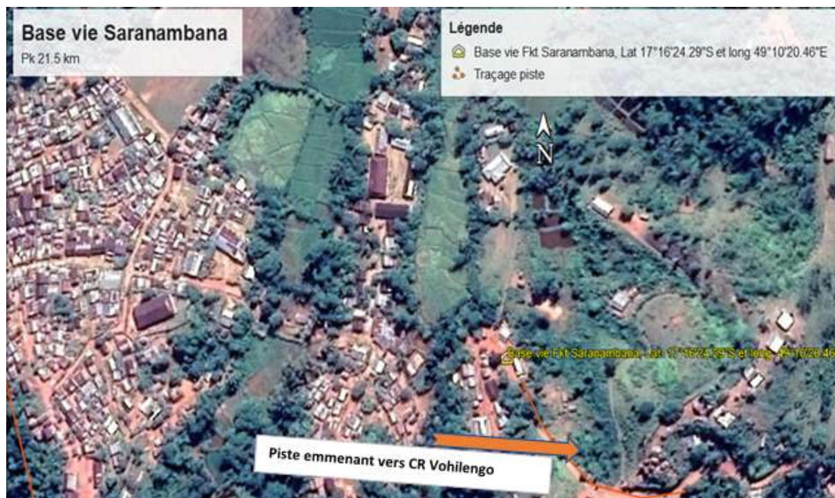
Figure n°2: Localisation de la Base Vie à Saranambana

Les coordonnées géographiques de ce site sont : 17°16'24.29"S / 49°10'20.46"E