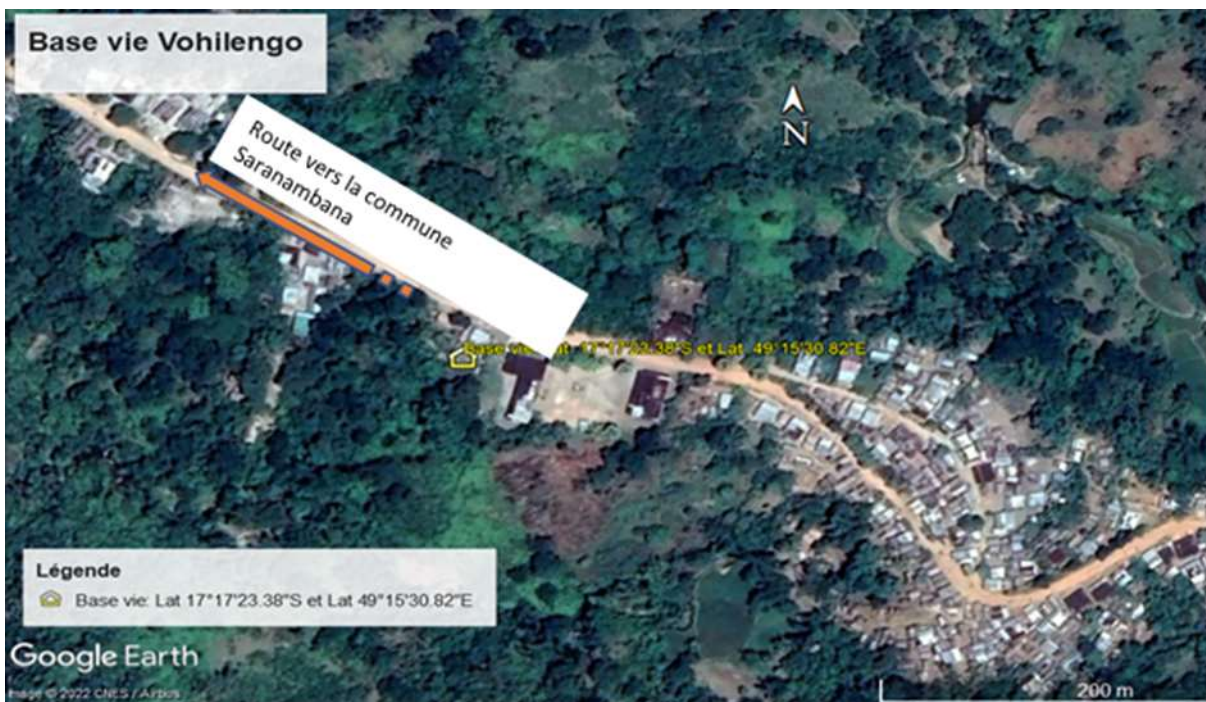
Figure n°1 : Localisation de la Base Vie au niveau de Fokontany de Vohilengo

Les coordonnées géographiques de ce site sont : 17°17'25.95"S / 49°15'37.32"E